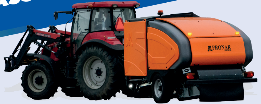
ZUIG-VEEGCOMBINATIES MET HOOGLOSSER