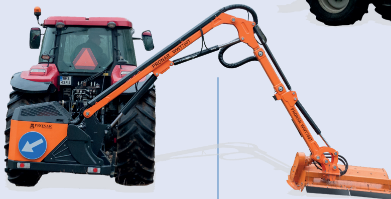
MULTIFUNCTIONELE (MAAI)ARMEN UIT TE VOEREN MET VERSCHILLENDE WERKTUIGEN