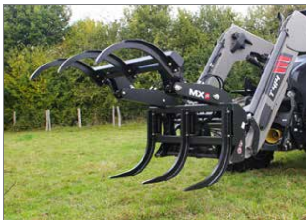
Vereiste hydraulica: 1 functie Optie: MACH 2 NS-stekker

Werkt niet in combinatie met SPEED-LINK- of Euro-aankoppeling