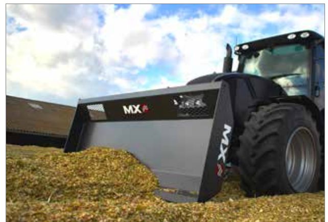
Optie: MACH 2 NS-stekker