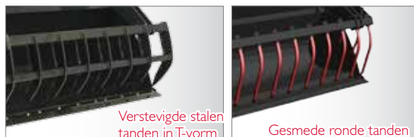
Verstevigde stalen tanden in T-vorm