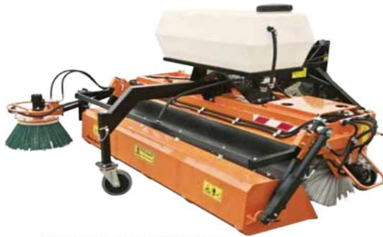
AGATA ZM-2000 SWEEPER