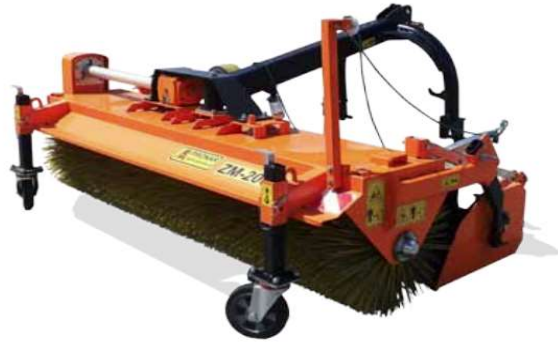
AGATA ZM-2000M SWEEPER

De werkbreedte van slechts 1,25m (kleinste uit het aanbod) is een groot voordeel van deze machine. Dit ontwerp maakt het mogelijk voor gemakkelijk manoeuvreren in smalle ruimtes, paden en krappe steegjes. Dankzij de constructie kan de ZM-1250 dat zijn gemonteerd op veel transportvoertuigen en is een product waar onderhoudsbedrijven om vragen.