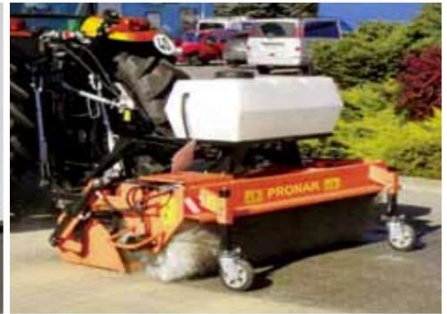
Sprinkler system reduces dust and particulate emissions.