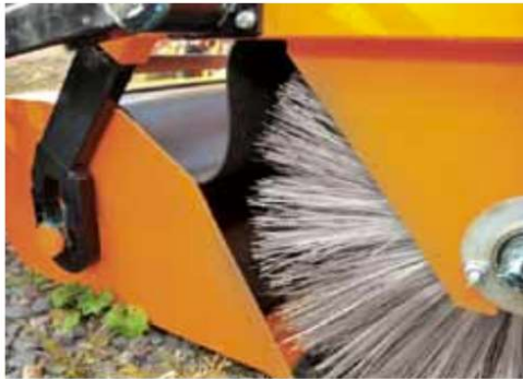
Brush and collection container.

De werkbreedte van slechts 1,25m (kleinste uit het aanbod) is een groot voordeel van deze machine. Dit ontwerp maakt het mogelijk voor gemakkelijk manoeuvreren in smalle ruimtes, paden en krappe steegjes. Dankzij de constructie kan de ZM-1250 dat zijn gemonteerd op veel transportvoertuigen en is een product waar onderhoudsbedrijven om vragen.