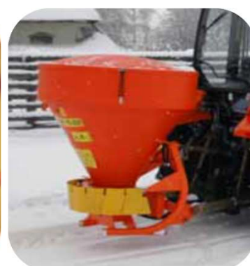
Inhoud van 250 of 500 liter