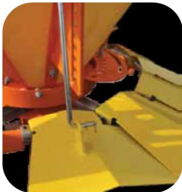
Aanpassing van de strooibreedte

Optioneel hydraulisch sluiten van de uitworp